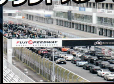
グランドスタンド席のメリット③