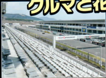
グランドスタンド席のメリット①

約1.5kmのホームストレート演出を体感できる特等席! クルマと花火の共演は「グランドスタンド席」のみ!