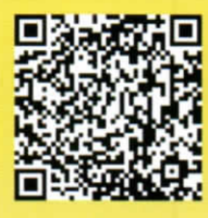
市公式ウェブサイト