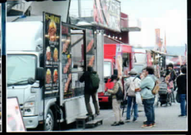
グランドスタンド席のメリット④