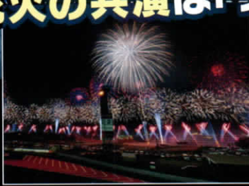
グランドスタンド席のメリット②